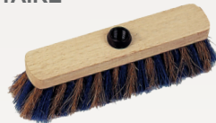
..... BALAI COCO ZEBRE (réf. T35)