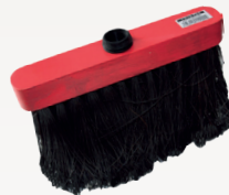
..... BALAI 3 RANGS PIASSAVA 25 CM (réf. T37)