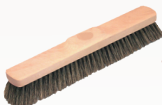
..... BALAI SOIE GRISE 38CM (réf. T43)