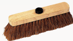
..... BALAI COCO 29 cm (réf. T40)