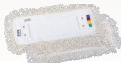
● ● ● ● ● ● FRANGES A LANGUETTES (réf. V51L)